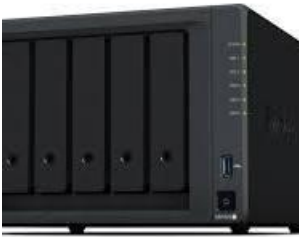
Photo storage option